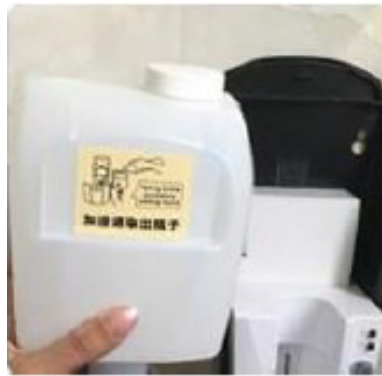
2) Rimuovere il serbatoio vuoto