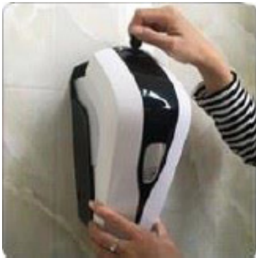
1) Aprire il dispenser