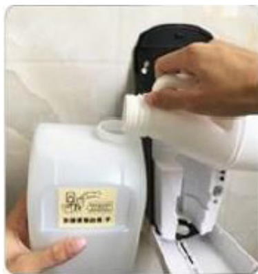
4) Riempire il serbatoio con liquido igienizzante