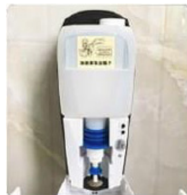
5) Riposizionare il serbatoio