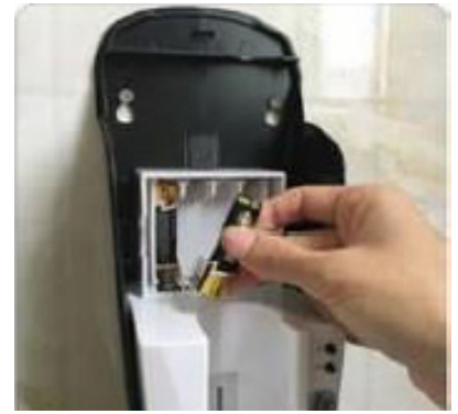
3) Installare pz. 8 batterie AA